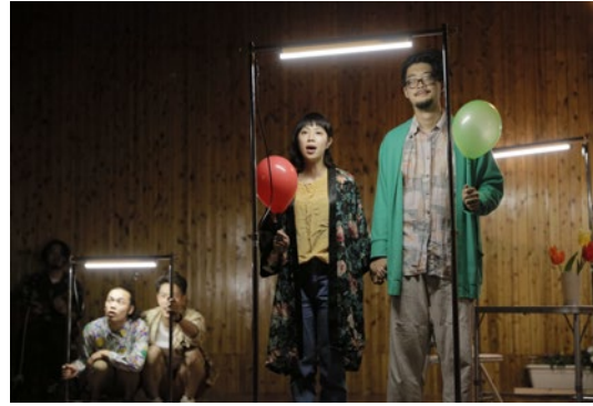
2018年『ハミンソング』より